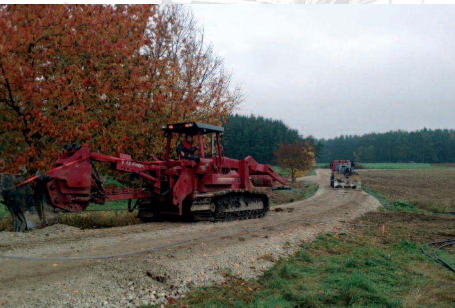
Oberfläche unmittelbar nach dem Pflügen.