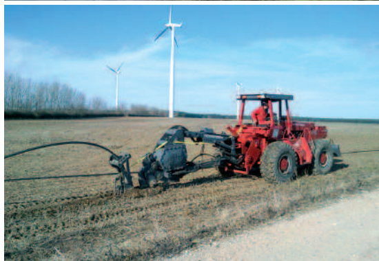
Einpflügen 3 x KSR PE-HD DA 50 mit Trommeltransport.